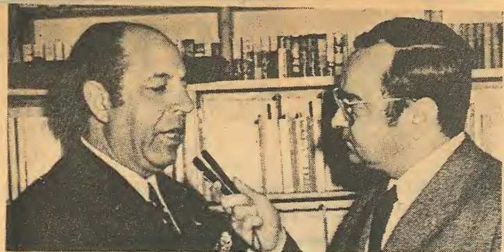
El gran maestro del cante jondo, Antonio Mairena, es entrevistado para la radio, con motivo del acto de presentación de su disco «Honosres a la Niña de los Peines», celebrado durante la Feria de Sevilla en una conocida sala de la capital. Constituyó uno de los actos culturales más sobresalientes de la temporada.

Hoy el gran maestro es Antonio Mairena, quien profundizó en el estudio del género con la dedicación que pone en todas las cosas del flamenco. Y pocos más contemporáneos podemos citar. Porque en bocas de muchos irresponsables que cantan lo que les viene en gana, sin facultades ni conocimientos, la saeta se halla en franca deca-